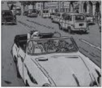
La dernière photo de notre reporter, au volant de son cabriolet, sur l'avenue de la Bastille à son retour...

Il est très intelligent, et a une grande capacité de travail. Il est très organisé, et sait toujours ce qu'il a à faire.